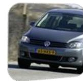
Volkswagen Golf Plus 1.4 2008

De auto die is gebruikt voor alle vergelijkingen is een Volkswagen Golf Plus 1.4 TSI 90kW Trendline uit 2008 met een nieuwwaarde van € 22.680,- en geschatte dagwaarde van € 7.830,-.